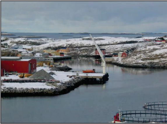
Fløttingen (industrikai). Egned depot.