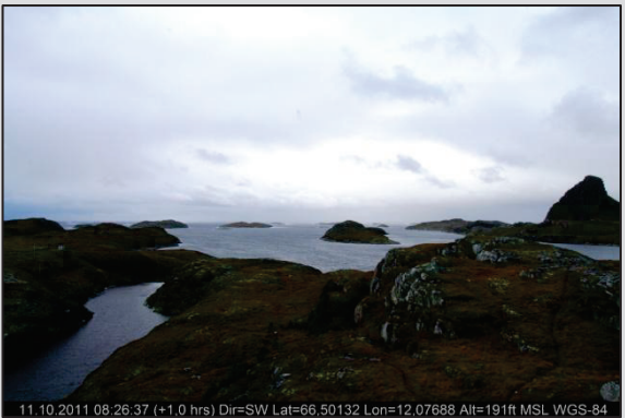
Mot Storfroa og Kvaløya Mob-D. Mot SV