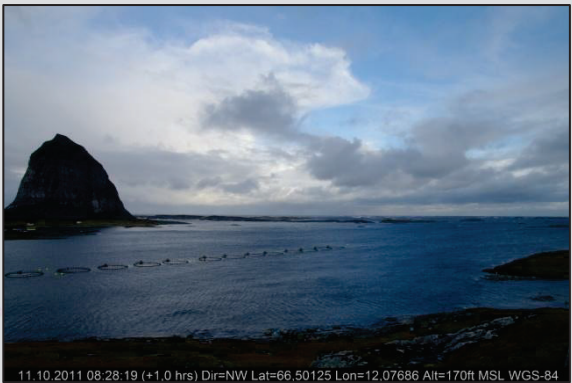
Sannavær Mob-B. Mot NV.