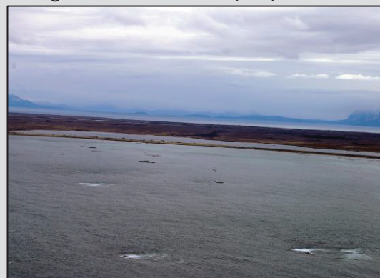
Skogvollbukta sett fra Vest (03a)