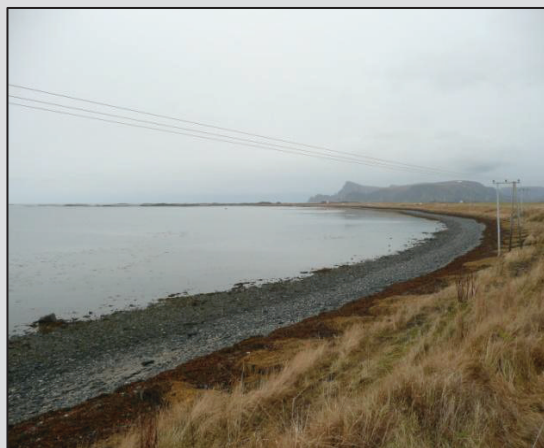
Skogvollbukta sett fra Sør (03b)