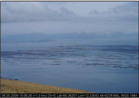
Sleneset-Svenningen mot øst