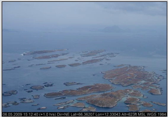
Storkvalholmen mot NØ